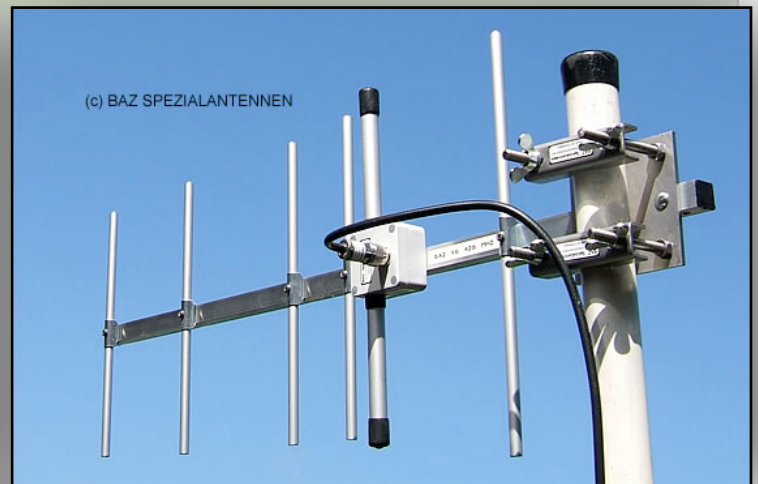
6 Element Yagi-Richtantenne