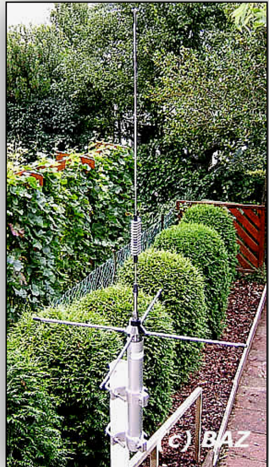
Rundstrahlantenne 433 MHz